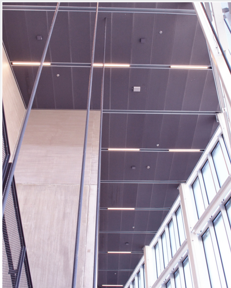
Projekt: Handelshögskolan, Örebro | System 3000A.